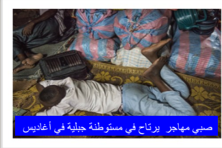
صبي مهاجر يرتاح في مستوطنة جبلية في أغاديس