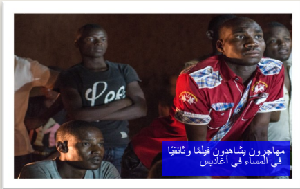
مهاجرون يشاهدون فيلماً وناقلاً في المساء في أغاديس